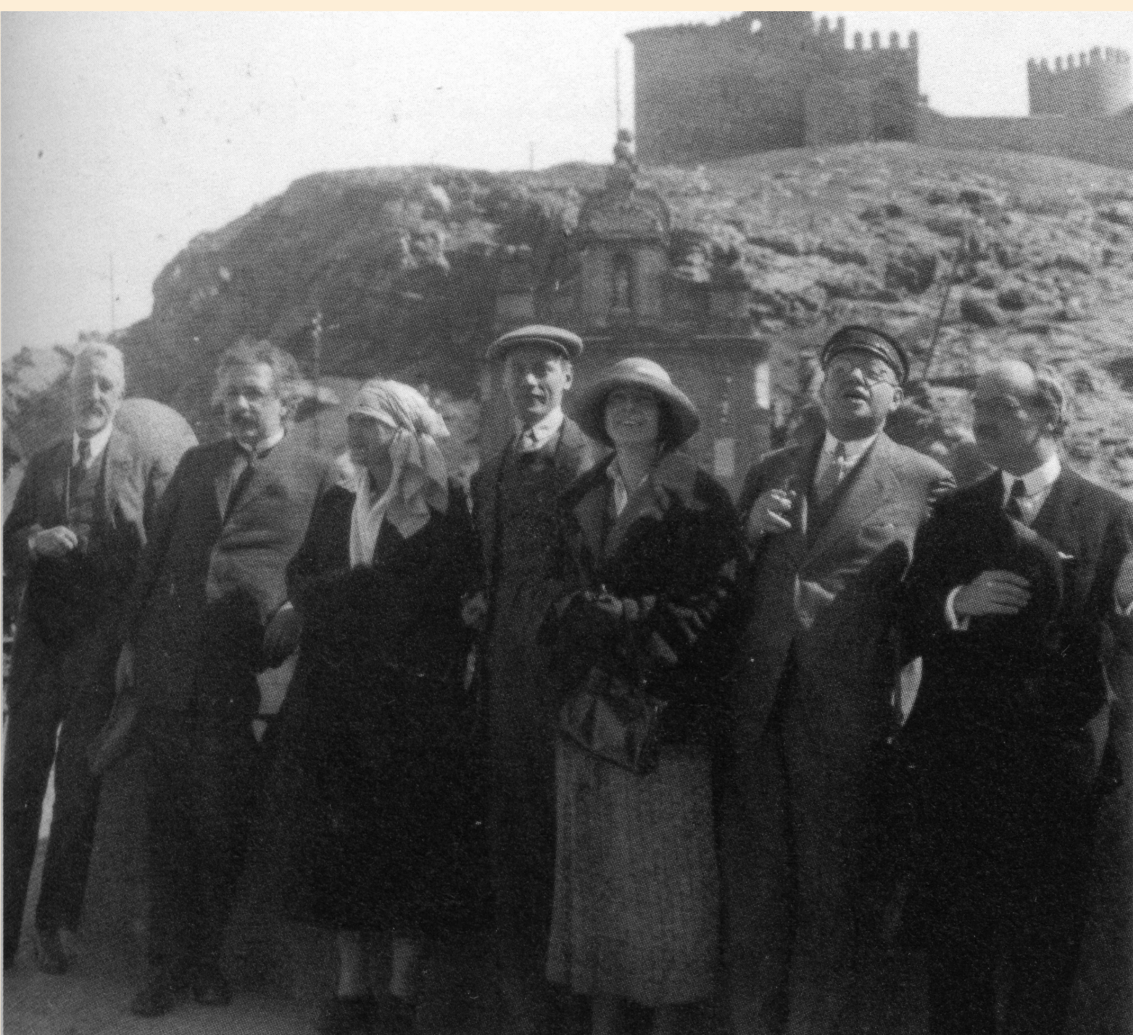
Visita a Toledo con Ortega y Gasset y Bartolomé Cossío