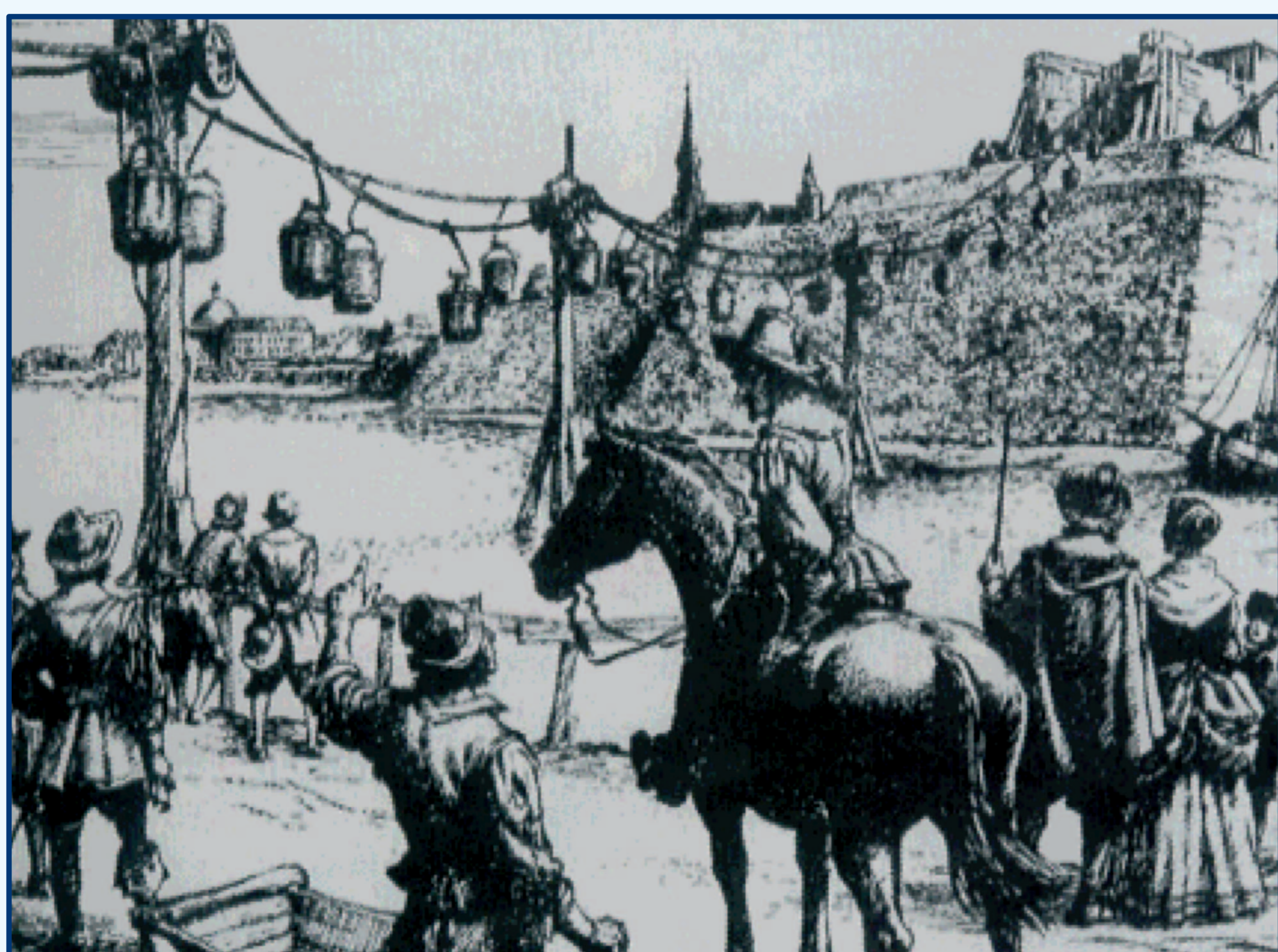
Adam Wybe (1644)

La segunda etapa , que servirá de prólogo a la obra de Torres Quevedo, se caracteriza por la utilización de cables metálicos fabricados industrialmente en la segunda mitad del siglo XIX.