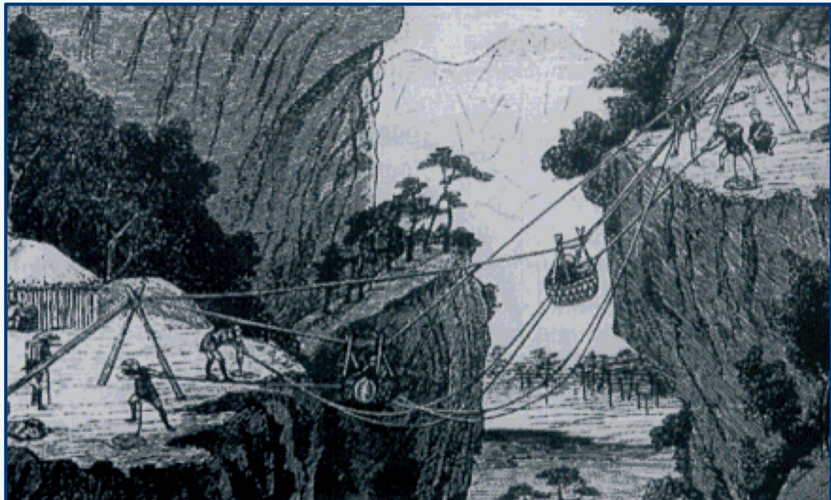
Transbordador en la China Imperial (1250)

En la prehistoria de los transbordadores existen noticias más o menos documentadas de diferentes obras, todas ellas en una primera etapa basada en el uso de cables de cáñamo . En unos casos con cable portante-tractor único y en otros distinguiendo entre ambos, uno más grueso sobre el que se sitúa la barquilla y otro, independiente, del que se tira desde las orillas para desplazarla.