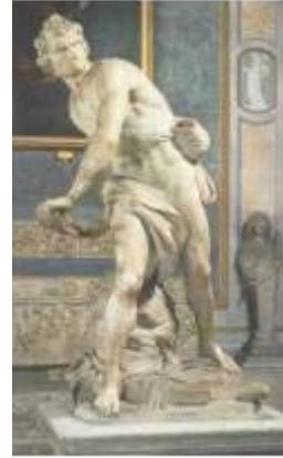
3. David (Bernini). Barroco