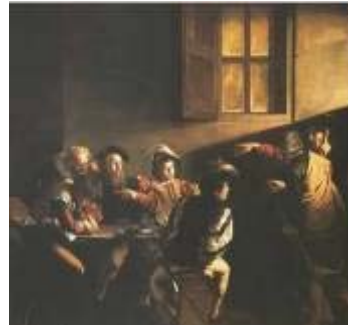
2. Vocación de San Mateo (Caravaggio)