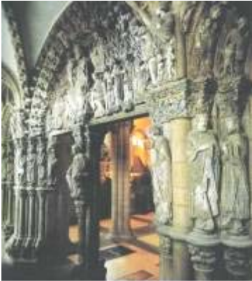
1. Pórtico de la Gloria. Santiago de Compostela Románico