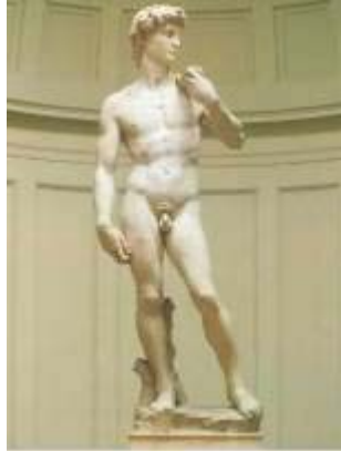
2. David (Miguel Ángel) Renacimiento