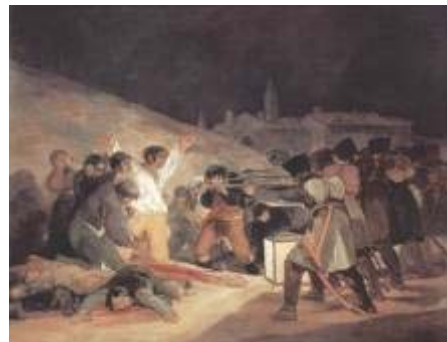
4. Fusilamientos (Goya)