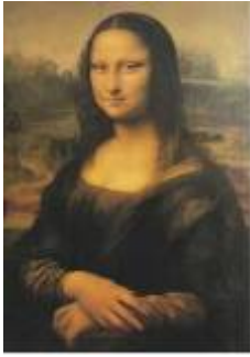
1. Gioconda (Leonardo)