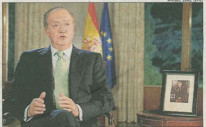
ÁNGEL DÍAZ (EFE)

El Rey pidió en su mensaje de Navidad dirigido a los españoles honradez en las actuaciones de los políticos y apeló a la unidad para superar tensiones y divisiones para que la economía vuelva a crecer y a crear empleo cuanto antes, de forma sostenible.