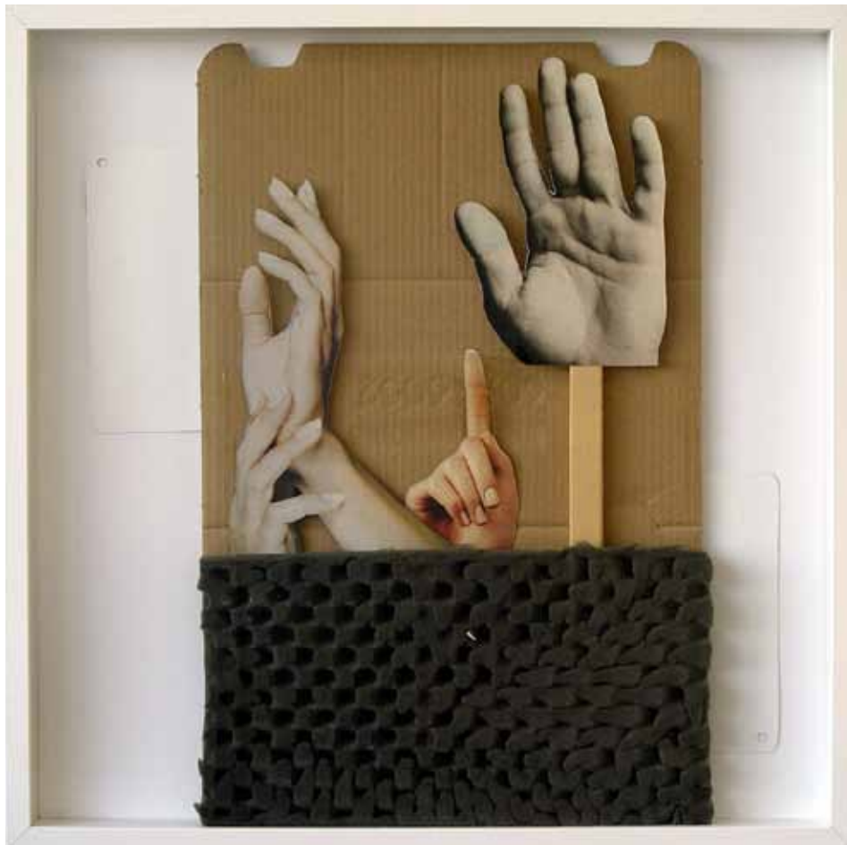
Los indignados, 2011 / The indignant, 2011

Cartón pluma, papel, madera, cartón microcanal y espuma de poliuretano - caja. 60 x 60 cms.