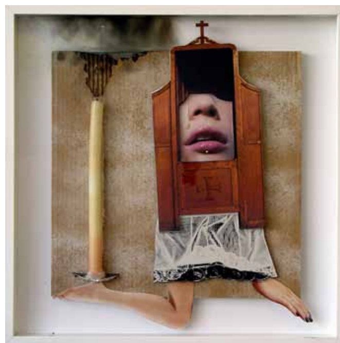
La feligresa, 2011 / The parishioner, 2011

Cartón pluma, papel, espejo, salvamanteles, y vinilo adhesivo - caja. 60 x 60 cms. Foam board, paper, mirror, mat, and vinyl adhesive - box. 60 x 60 cms.