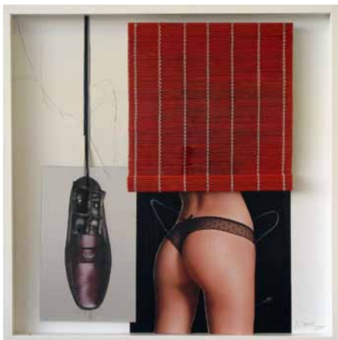
La diosa, 2011 / The goddess, 2011

Cartón pluma, papel, espejo, salvamanteles, y vinilo adhesivo - caja. 60 x 60 cms. Foam board, paper, mirror, mat, and vinyl adhesive - box. 60 x 60 cms.