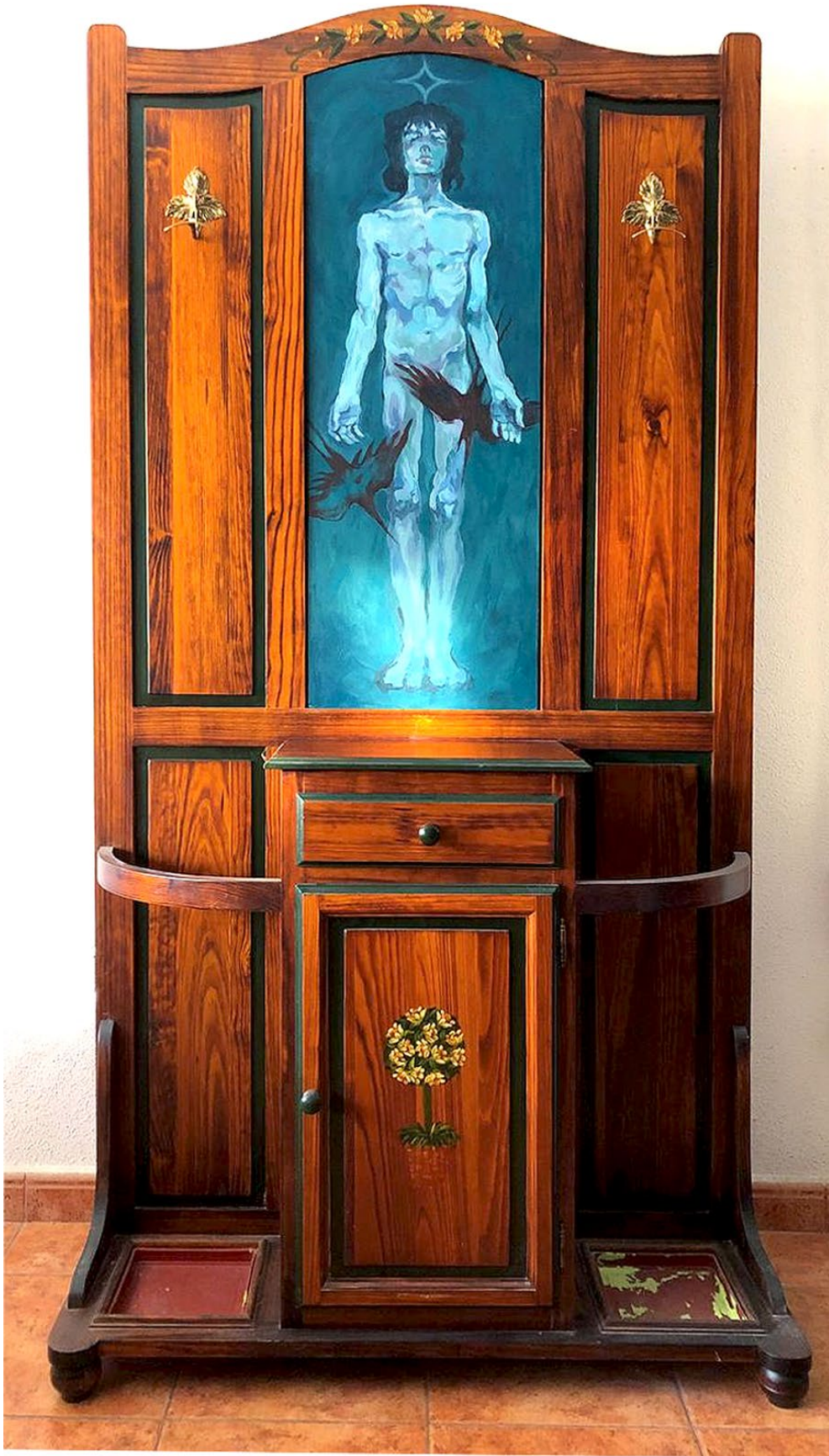
Fig. 5. Eric Gómez (2024). Saudade . Retrablo sobre armario, acrílico. 190 x 100 x 30 cm.