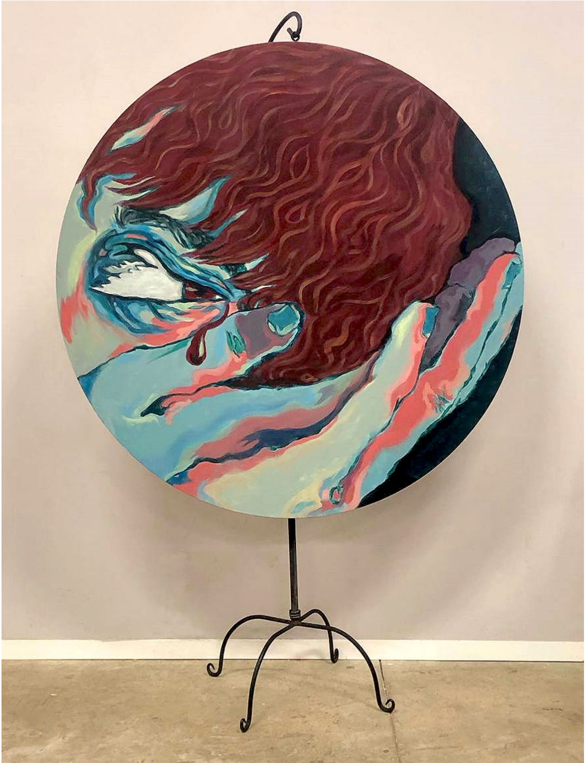
Fig. 4. Eric Gómez (2024). La enfermedad de rayo . Peana y acrílico sobre lienzo. 100 x 100 cm