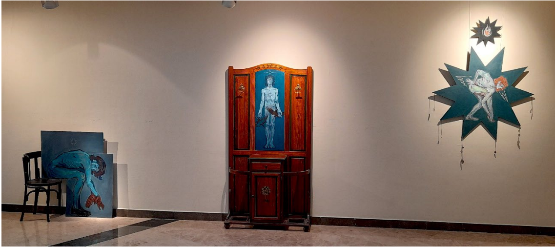
Fig. 8. Huir para dejar de huir de Eric Gómez en la Sala de exposiciones del CSU (2024).