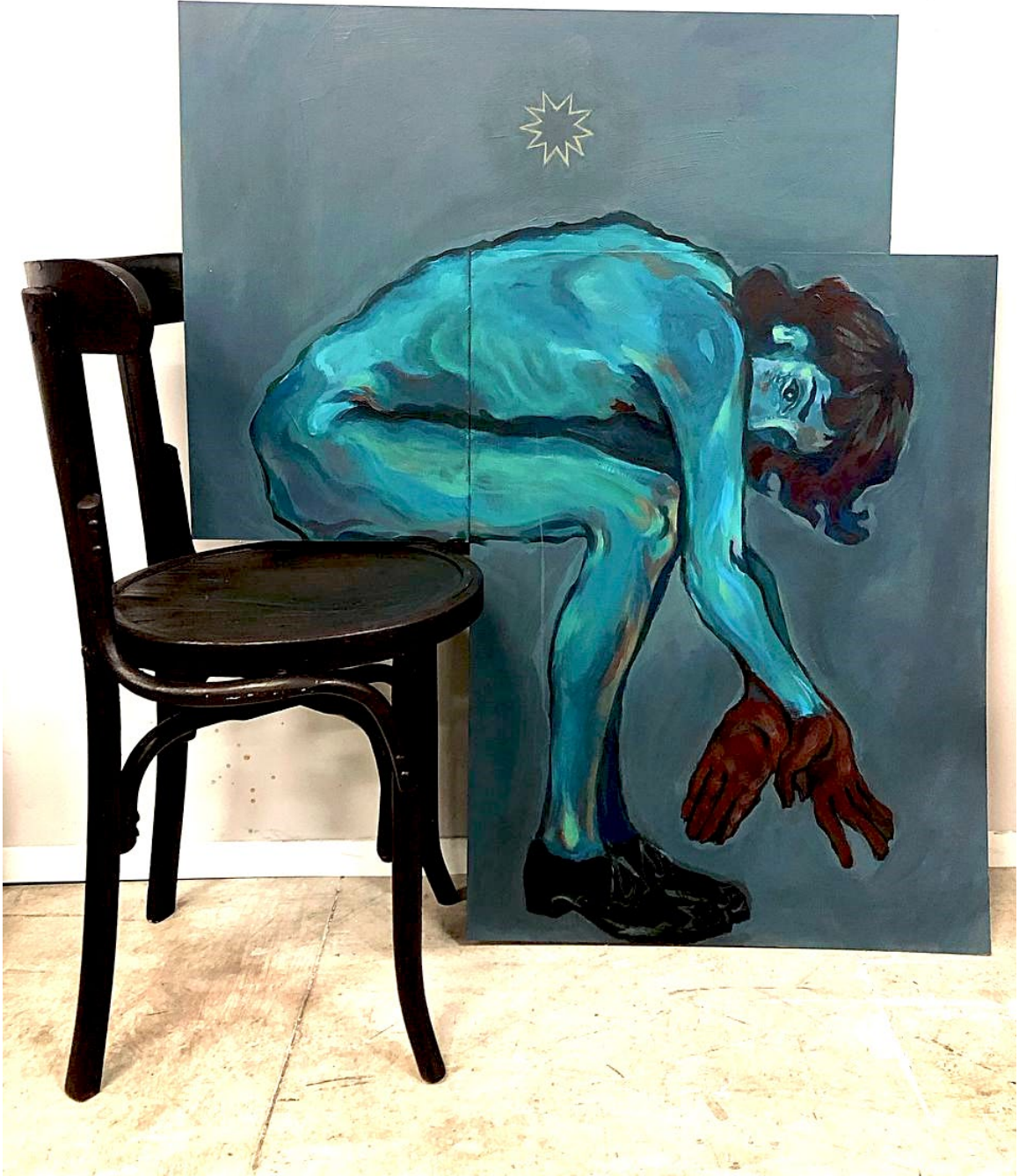
Fig. 2. Eric Gómez (2024). La tercera mano de Dios . Silla y acrílico sobre DM. 107 x 93 cm.