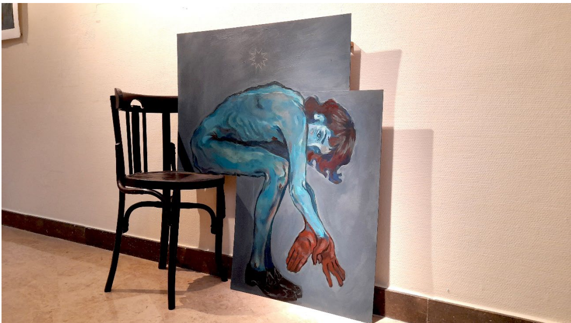
Fig. 7. Fotografía panorámica de Huir para dejar de huir de Eric Gómez en la Sala de exposiciones del CSU (2024).