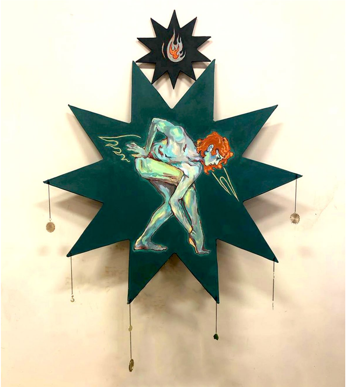
Fig. 3. Eric Gómez (2024). No me querran, pero me creeran . Intervencion y acrilico sobre tablas enteladas. 110 x 110 cm y 33 x 33 cm