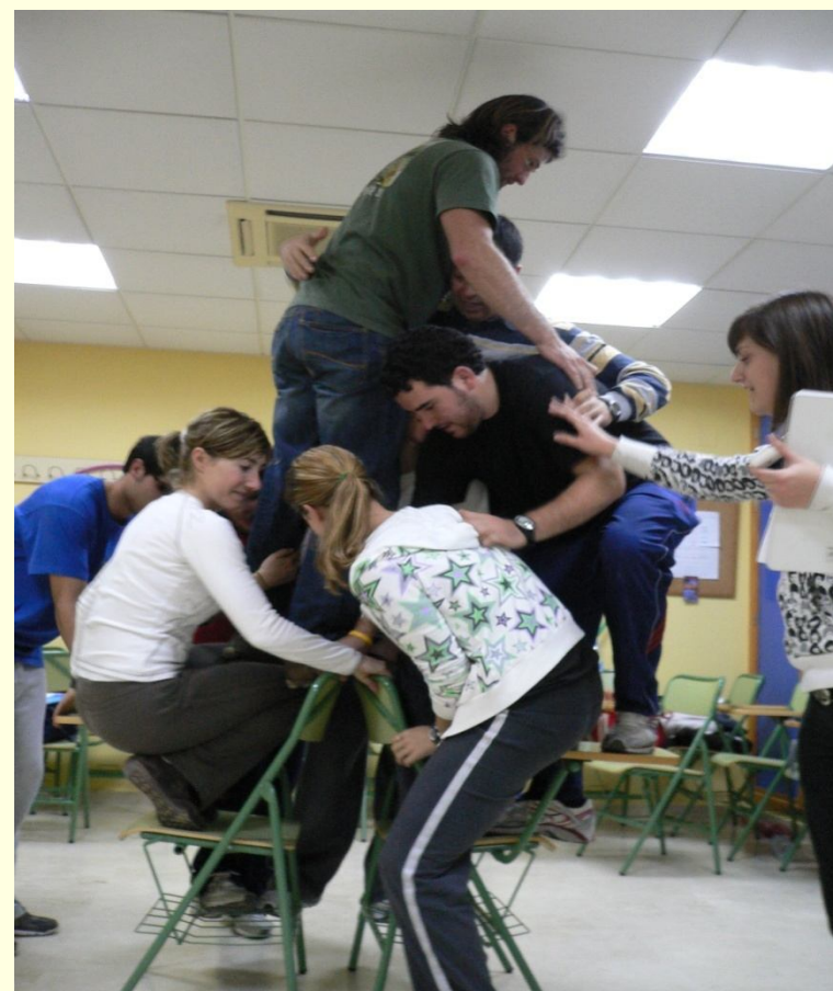
P.I. "FORMACIÓN DE TÉCNICOS EN EL PRPS DE HELLISON"