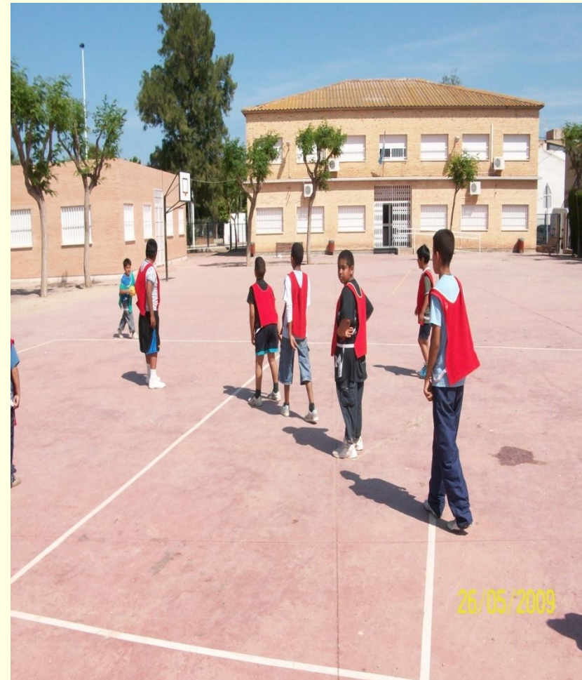
P.I. "FORMACIÓN DE TÉCNICOS EN EL PRPS DE HELLISON"