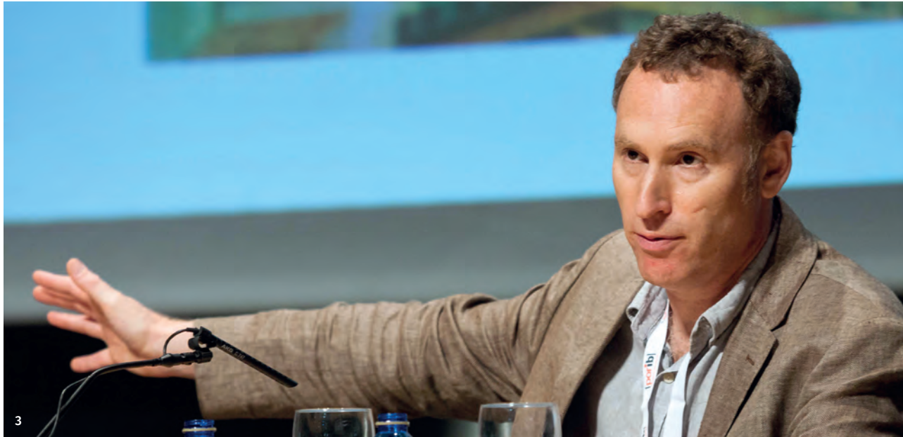
3 Andrew Street, de la University of York, fue el encargado de impartir la conferencia inaugural.