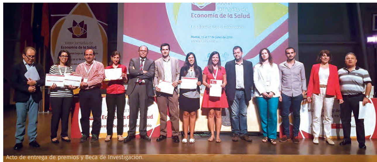
Acto de entrega de premios y Beca de Investigación.

1 Departamento de Economía Aplicada. Universidad de Murcia. Presidente de la Asociación de Economía de la Salud (AES). 2 Departamento de Economía. Universidad Nacional de Educación a Distancia (UNED). Presidente del Comité Científico de las Jornadas. 3 Departamento de Economía Aplicada. Universidad de Murcia. Presidente del Comité Organizador de las Jornadas.