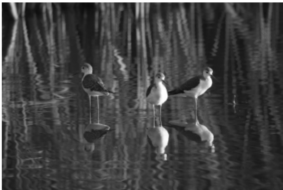
Figura 1. Grupo de cigüeñuelas comunes ( Himantopus himantopus ) sobre una laguna litoral de Motril (Granada).

Dado el interés de este conjunto de especies y su importante representación dentro de la región que nos atañe, en la presente aportación se pretende ofrecer una idea global acerca del conjunto ornítico, en acepción extensa, dependiente de los humedales del Sudeste Ibérico (principalmente lagunas, embalses y áreas encharcables) para su supervivencia. Con tal motivo se describen los elementos y rasgos ecológicos más característicos de las distintas comunidades de aves pobladoras de estas masas de agua. Por último, también se pormenorizan los principales