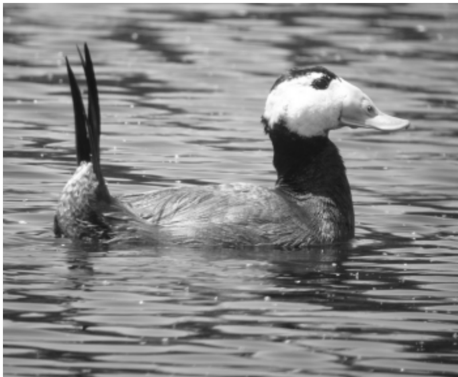
Figura 9. La malvasía cabeciblanca ( Oxyura leucocephala ) se constituye como uno de los patos globalmente más amenazados que encuentra en las lagunas almerienses uno de sus principales sitios de cría e invernada en Europa.

buscando las escasas láminas de agua aún existentes en la estación seca. Además, tampoco permanece similar la riqueza y la abundancia de acuáticas de año en año, ya que los humedales del Sudeste y por contradictorio que parezca, son invadidos principalmente durante las anualidades con menores tasas de lluvia en el sur de España. Ello posiblemente sea debido a la pérdida de muchas láminas de agua en la mitad Sur de la Península Ibérica por desecación durante los años de mayor aridez, quedando como reservorios donde refugiarse las aves acuáticas, entre otros, los reductos granadinos, almerienses o murcianos que presentan agua permanente incluso en los años más secos. En este sentido, el carácter permanente de la mayor parte de las lagunas y salinas costeras de estas provincias incrementa su valor como