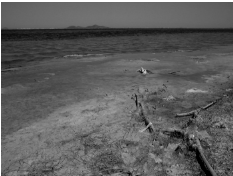
Figura 7. El Mar Menor (Murcia) conforma el mayor humedal en extensión de todo el litoral mediterráneo español, con más de 13.400 ha.