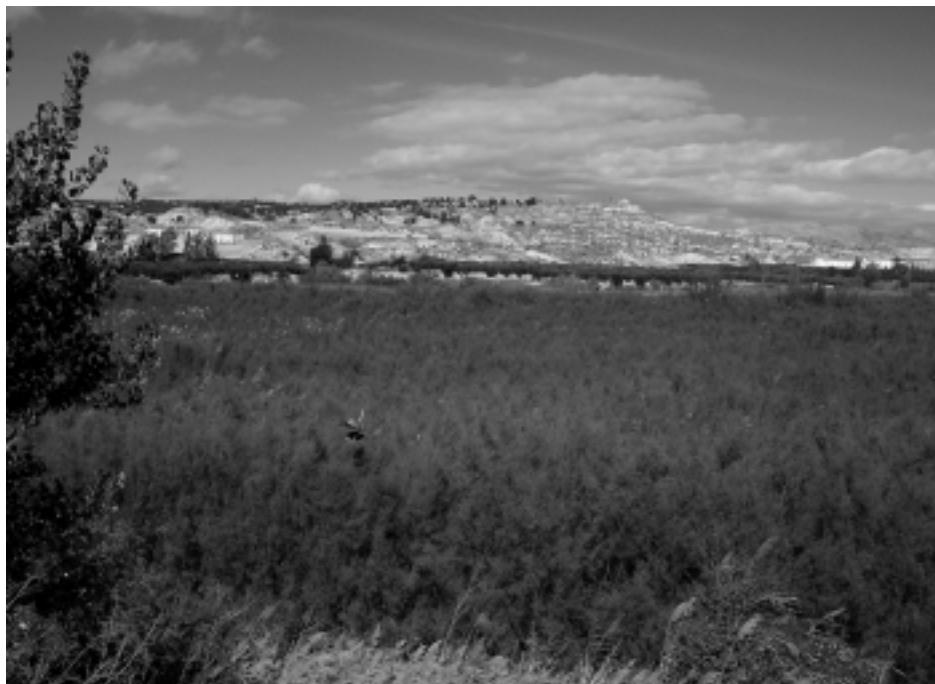
Figura 10. Las amplias masas de tarajes, características de los humedales de la región más árida peninsular, proporcionan un refugio óptimo para numerosas aves zancudas, ánátidas y passeriformes en invierno y durante sus migraciones. En la imagen, tarayal en la junta de los ríos Castril y Guardal (Granada).

ría de especies tampoco residen a lo largo del año en nuestros carrizales, inducidas por su elevada estacionalidad ambiental latente provocada por los acusados cambios en la fenología de crecimiento del carrizo. Por otro lado, las suaves temperaturas de la zona favorecen su uso principalmente durante el período otoñal-invernal.