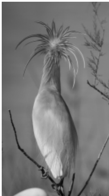
Figura 19. Garcilla cangrejera ( Ardeola ralloides ).