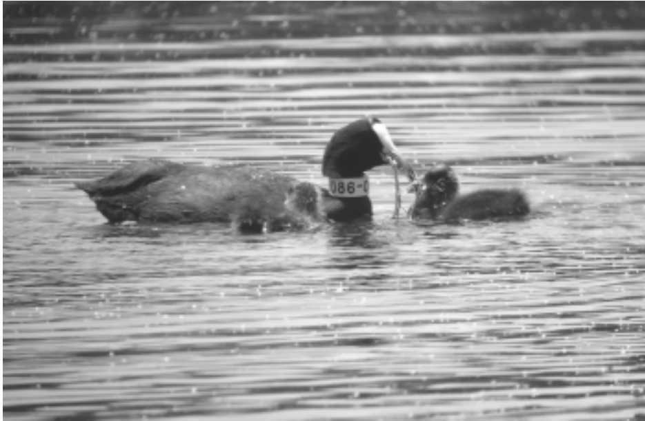
Figura 11. La focha moruna ( Fulica cristata ), aun siendo muy escasa en el Sudeste, es una especie amenazada que ha llegado a reproducirse con éxito en alguna de sus lagunas durante los últimos años gracias a los programas de reintroducción llevados a cabo.