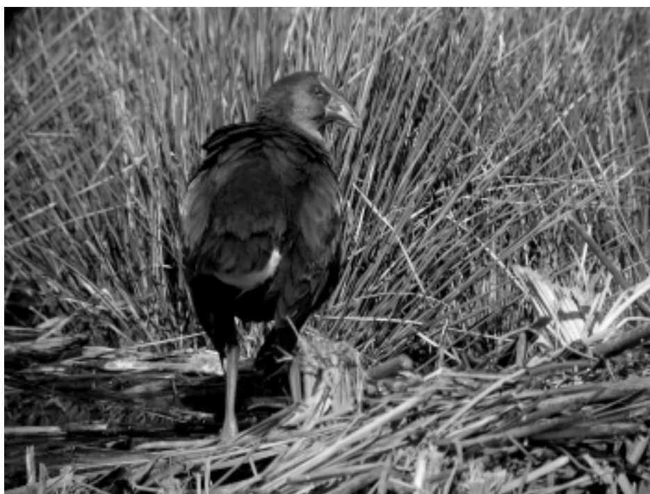
Figura 3. El calamón común ( Porphyrio porphyrio ) es una especie en recuperación que se ha adaptado bien a casi cualquier tipo de humedal, llegando a criar en colas de embalses y pequeñas charcas litorales muy degradadas. En la imagen, calamón común en Desembocadura del Guadalfeo (Granada).

Muchas de estas particularidades, las cuales conforman la idiosincrasia propia de estos originales sistemas, van a condicionar la habitabilidad de su medio por la biocenosis colonizadora y, por tanto, por las aves que crían, se alimentan, reposan o, en definitiva, aprovechan los recursos disponibles en su medio natural.