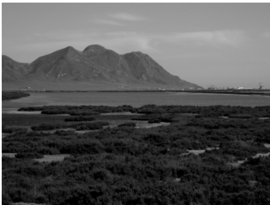
Figura 6. Las Salinas del Cabo de Gata (Almería) constituyen uno de los últimos enclaves salineros aún activos a día de hoy en Europa.

Los hábitats de carrizal conforman un tipo de biotopos asociados a las áreas menos salinas de los humedales, normalmente encharcados y predominantemente formados por exuberante vegetación de tallos altos y verticales de hierbas gigantes