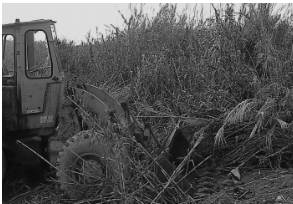
Figura 17. Uno de los principales motivos de desaparición de los humedales en el Sudeste Ibérico ha sido su destrucción para usos agrícolas o urbanísticos. En la foto, destrucción de vegetación palustre próxima a las Albuferas de Adra (Almería).

Los humedales, como sistemas naturales, deberían conservarse sin intervención alguna o con la mínima incidencia humana. Sin embargo, la afección antrópica que a día de hoy incide sobre este tipo de hábitats hace que, en la gran mayoría de casos, para mantener los ambientes palustres normalmente haya que establecer unas pautas de manejo y gestión. Teniendo en cuenta el valor ecológico de gran parte de los humedales de Granada, Almería y Murcia, así como la importancia de conservación de muchas de sus especies, existen diversas medidas prioritarias a adoptar en tales espacios con el propósito de que se dé una preservación y mejora en las condiciones ambientales relacionadas con las aves asociadas a su hábitat. Muchas de tales implicaciones de manejo han sido llevadas a cabo y/o se están ejecutando en la actualidad en diferentes espacios, si bien aún quedan por materia-