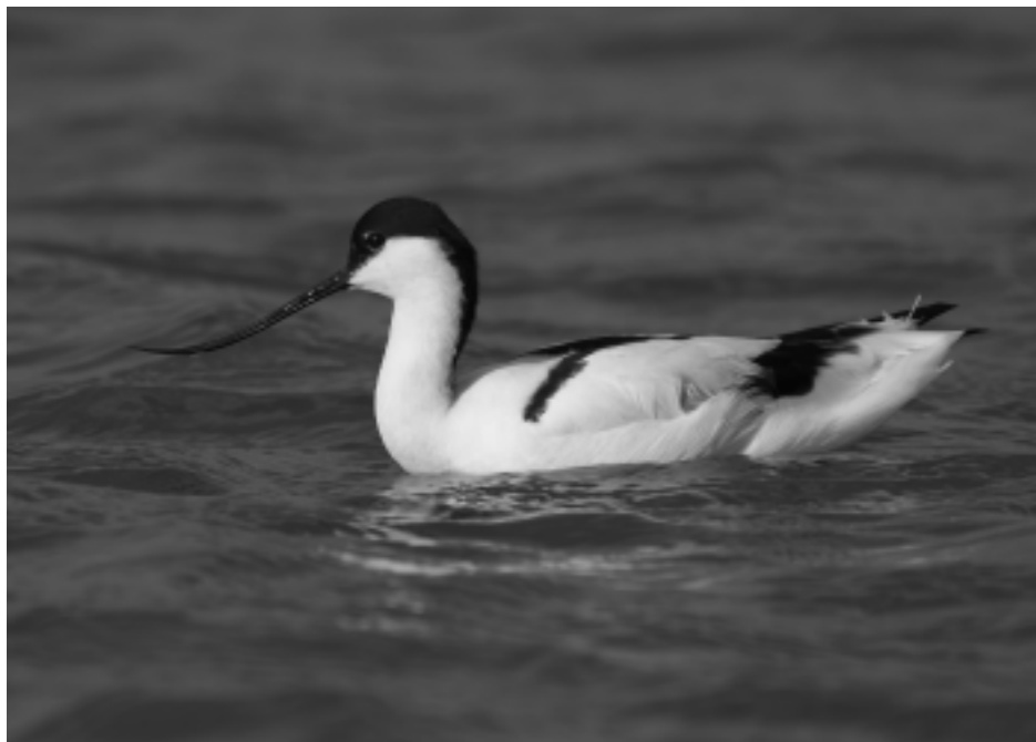
Figura 13. Las aves vadeadoras dominan las orillas fangosas y abiertas. Una de las especies más representativas de estos medios es la avoceta común ( Recurvirostra avosetta ).

y empobrecimiento de su hábitat durante los últimos tiempos. En este sentido, es muy relevante el dato de que en España haya desaparecido el 60% de la superficie húmeda existente hace 200 años, quedando un elevado porcentaje del área aún superviviente en un pobre estado de conservación. Tal impacto ha repercutido enormemente en su biocenosis y, concretamente, en su avifauna, agravando aún más si cabe la situación de escasez original de este tipo de ambientes.