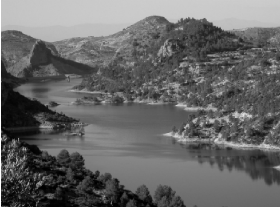
Figura 5. Probablemente el humedal que mayor número de efectivos invernantes atraiga en la provincia de Granada sea el embalse del Portillo. Su nivel muy constante de la lámina de agua ha posibilitado el establecimiento de importantes poblaciones de aves acuáticas durante todo el año.

das por la proximidad del nivel freático a la superficie del humedal. Los tipos extremos son, por un lado, los criptohumedales (saladares y estepas salinas), generalmente carentes de agua en superficie pero caracterizados por la presencia comunidades halófilas diferenciadas, y por una sedimentología e hidrología superficial que implican depósitos salinos, semiendorreísmo, alta evaporación y ascenso capilar de agua cargada de sales. En el lado opuesto se encuentran los complejos palustres provistos de una lámina de agua más o menos permanente y de orlas o masas de helófitos (carrizales) o vegetación halófila (almarjales), dependiendo de la salinidad del agua. Los principales complejos palustres interiores son de origen artificial y se corresponden con algunos arrozales y un número importante de embalses. Los arrozales son sistemas fluviales de aguas dulces y