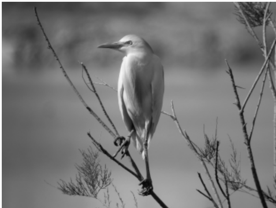
Figura 15. Aún siendo frecuente encontrar a la garcilla bueyera ( Bubulcus ibis ) alimentándose en hábitats alternativos a los palustres, en algunos de los humedales del Sudeste Ibérico suele ubicar importantes dormideros o colonias de cría.

situaciones de sequía, y llega entonces a afectar a grandes masas de agua embalsada.