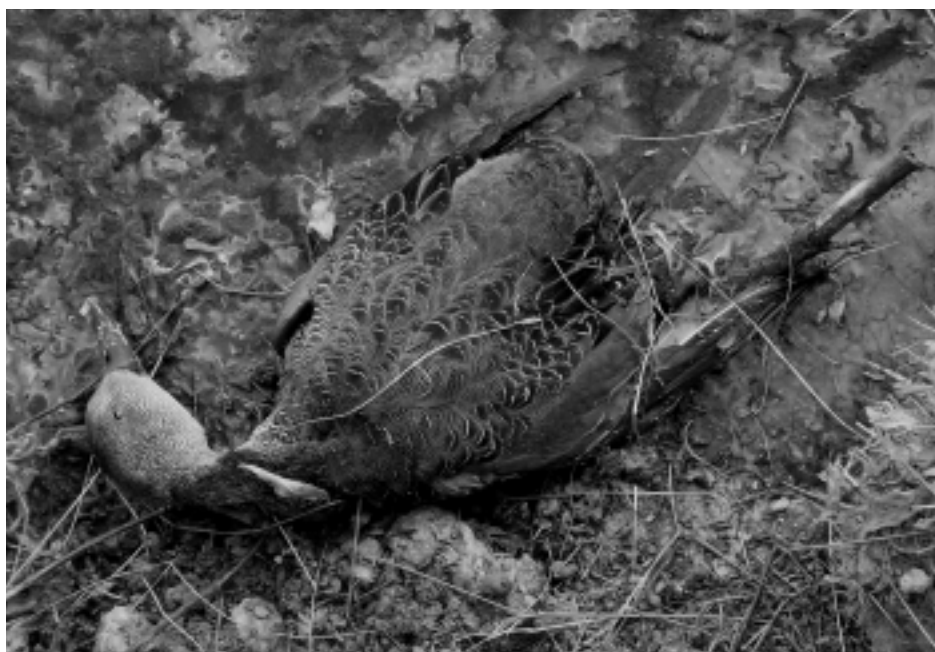
Figura 18. Los episodios de envenenamientos masivos de aves acuáticas son uno de los efectos colaterales de los tratamientos agrícolas por fitosanitarios. En la imagen, ánade rabudo ( Anas acuta ) envenenado en la Balsa del Regidor (Granada).