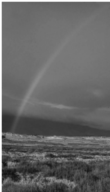
Figura 12. Los saladares son importantes medios ligados a las zonas palustres más salinas que actualmente se encuentran amenazados en muchos casos. En la foto, saladar de las antiguas Salinas de Guardias Viejas (Almería) ya desaparecidas por motivos urbanísticos.

A tales valores ornitológicos de los humedales del Sudeste hay que sumarle el elevado interés de conservación de sus hábitats o de otros animales, dado que gran parte de ellos, como la mayoría de las praderas de macroalgas y macrófitos sumergidos, los tarayales y los saladares, el galápago leproso ( Mauromys leprosa ) o el fartet ( Lebias iberica ), se encuentran incluidos en los Anexos I y II de la Directiva Hábitats como hábitats y especies cuya conservación requiere la designación de zonas de especial conservación (Directiva 92/43/CEE del Consejo, de 21 de mayo de 1992, DOCE, L 206, de 22 de julio de 1992; Directiva 97/62/CE del Consejo, de 27 de octubre de 1997, DOCE, L 305, de 8 de noviembre de 1997).