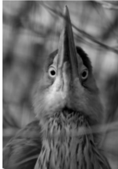
Figura 16. La presencia esporádica del avetoro común ( Botaurus stellaris ) en algunos cañaverales del sudeste complementa el valor ecológico estas zonas palustres.

Estos impactos en el hábitat ancestral de las aves que dependen de los humedales no han hecho más que restarles disponibilidad y calidad del medio para la supervivencia, incidiendo de forma palpable en su número y salud (muchas especies han visto decrecer su volumen poblacional como consecuencia de los cambios ambientales acaecidos en algunas lagunas, siendo gran parte de las patologías detectadas en aves acuáticas originadas o agravadas por la salubridad de sus aguas), así como en su distribución (algunas otras se han extinguido o mermado en determinados humedales por pérdida o empobrecimiento de hábitats favorables).