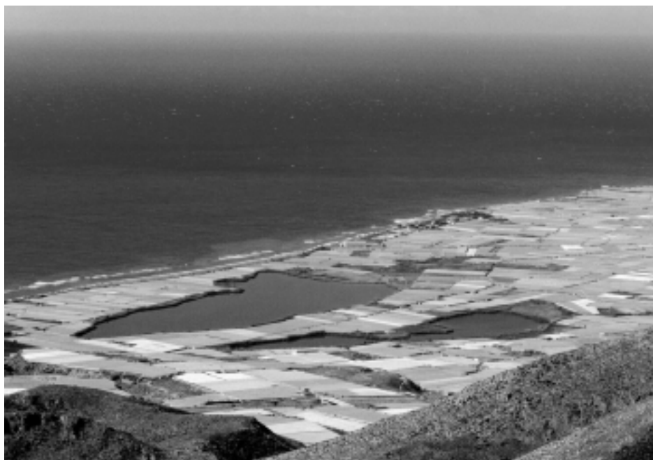
Figura 2. Los invernaderos actualmente se constituyen como uno de los principales problemas para la supervivencia y la conservación de los humedales en el Sudeste Ibérico. En la imagen, las Albuferas de Adra (Almería) como islas de agua en un mar de plástico.

y productivas y los servicios ambientales que prestan, por ejemplo mediante la producción de alimentos, la fertilización de las aguas costeras, la protección de las costas frente a la erosión, la amortiguación de las crecidas e inundaciones o la retención de nutrientes y contaminantes, previniendo la eutrofización y purificando las aguas continentales y marinas.