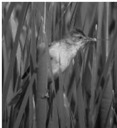
Figura 14. Dentro de los passeriformes, el grupo de los carriceros dominan ampliamente el medio del carrizal durante la nidificación. En la imagen, un carricero tordal ( Acrocephalus arundinaceus ) apresando un odonato.