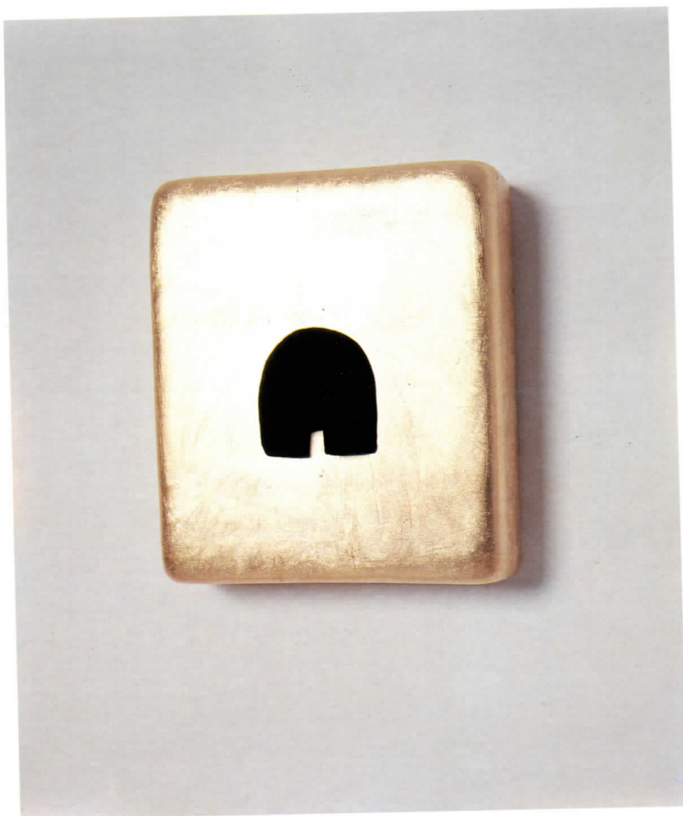
(DETALL DE LA INSTAL·LACIÓ) ICONA DE LA CASA. 1993 40 x 28 cm.