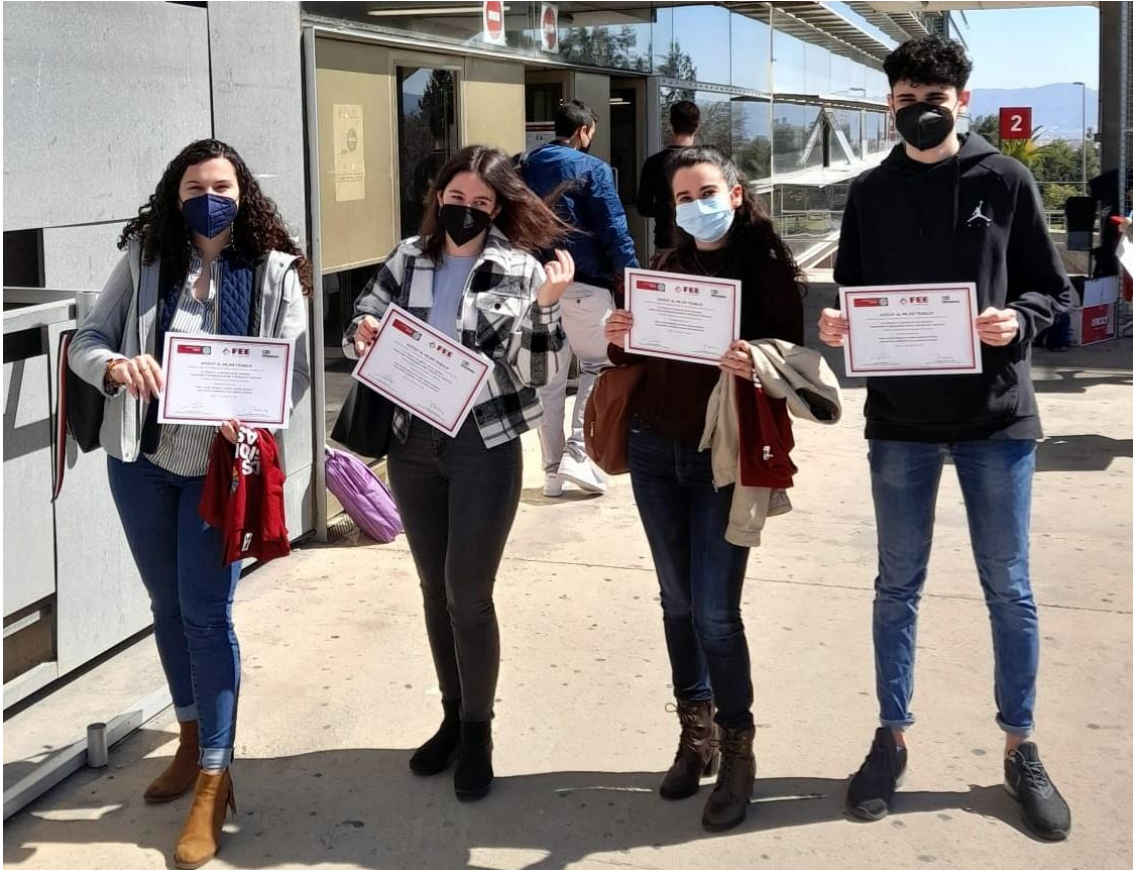
Acto de la entrega de premios ODShe presidido por el Vicerrector de Responsabilidad Social y Transparencia de la UMU. Exteriores del Campus de Espinardo, Economía y Empresa, 11/03/21 de marzo, 12,30-13,00 horas.