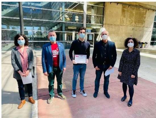
Entrega de Premios ODShe. Grados en DADE y Marketing