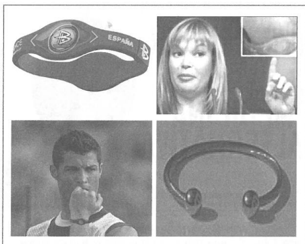
Imagen 3. En orden de izquierda a derecha: pulsera Power Balance, Leire Pajín y Cristiano Ronaldo lucíendola, y pulsera Rayma

En la década de los ochenta y los noventa era habitual que muchas personas lucieran una pulsera de cobre Rayma (consistente en un aro no completamente cerrado, sino rematado por dos pequeñas esferas) que, supuestamente, curaba el reumatismo debido a sus propiedades magnéticas.