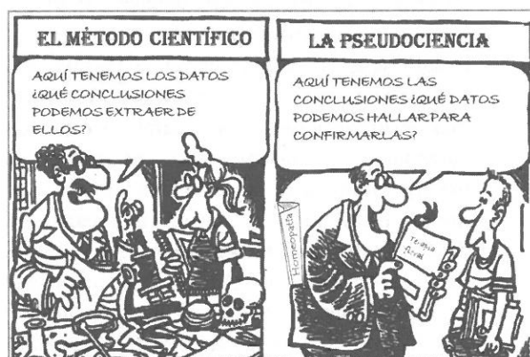
Imagen 1. Adaptación del dibujo original publicado en 1998 por John Trever en el Albuquerque Journal , donde, en lugar de la pseudociencia (en general), se criticaba el creacionismo (que también es una pseudociencia)

Por desgracia, el catálogo de pseudociencias es extenso, por lo que sólo reseñaremos aquellas que están más en boga o que, por sus características, son socialmente más destacables (por su extravagancia, por sus consecuencias para la salud o la economía de las personas...). En cada época predominan unas creencias que, posteriormente, son sustituidas (si bien no llegan a desaparecer completamente) por otras. Así, hace años estuvieron de moda los ovnis y las visitas de extraterrestres, el triángulo de las Bermudas, la percepción extrasensorial, las personas con