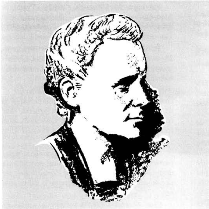
Maria Sklodowska-Curie (1867-1934)