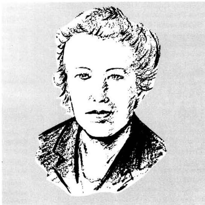
Maria Goeppert-Mayer (1906-1972)

Només dues dones han estat guardonades amb el Premi Nobel de Física. La primera, Maria Sklodowska-Curie, el va compartir l'any 1903 amb el seu marit, Pierre Curie, i amb Henri Becquerel pel descobriment de la radioactivitat natural. La segona va ser Maria Goeppert-Mayer, que l'any 1963 el va compartir amb Hans Jensen i Eugene Wigner pels treballs sobre el model de l'estructura nuclear en capes. Per la seva part, Maria Sklodowska-Curie va rebre també el Premi Nobel de Química de l'any 1911 pel descobriment del radi i el poloni.